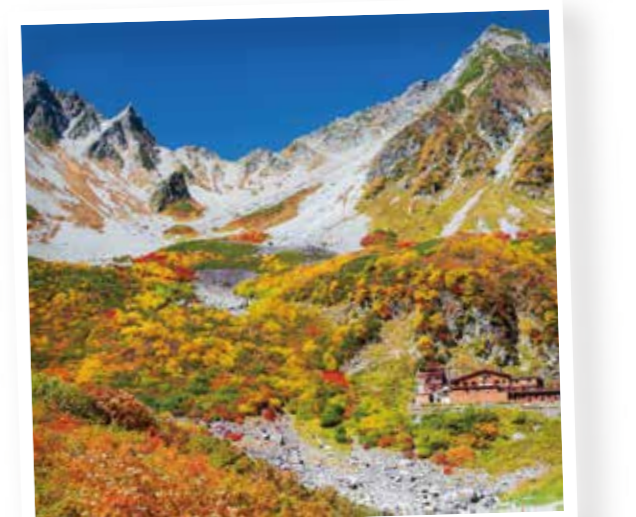
濁沢カールの紅葉