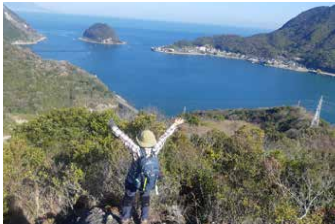
三角岳からの眺め